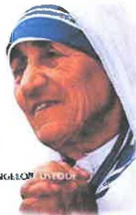
(Beata Madre Teresa di Calcutta)

C'è chi crede che tutto gli sia dovuto ma non è dovuto niente a nessuno: le cose si conquistano con dolcezza ed umiltà.